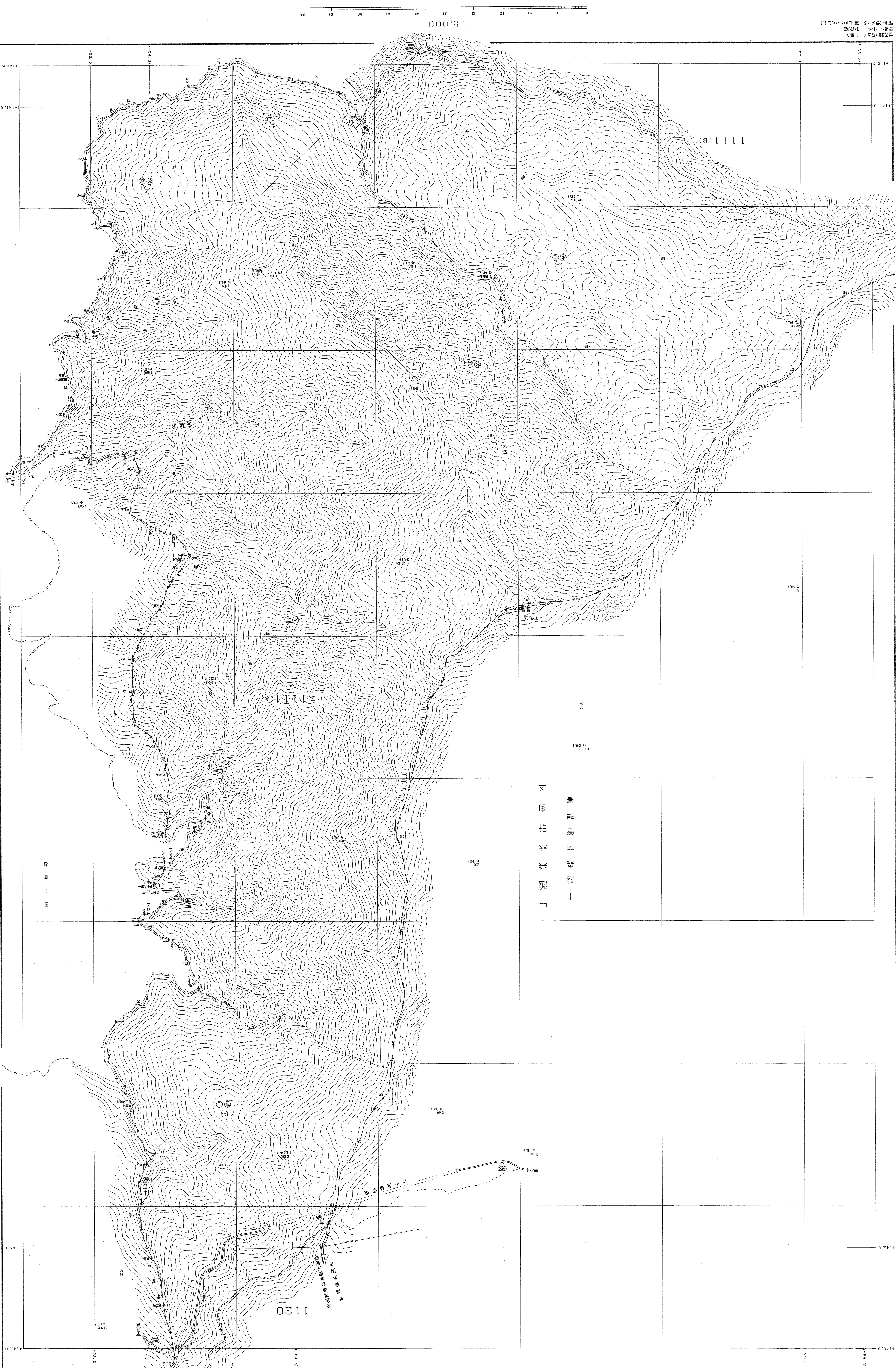
森林計画区・基本図

1111(A)林班 1:5,000 比例尺地形图 1111(A)林班 1:5,000 比例尺地形图