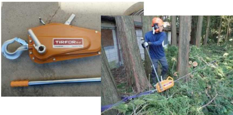
人材育成・確保のため安全機械器具を導入 (栃木県矢板市の事例)