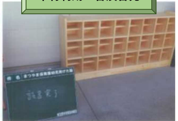
公立保育園に町産材を活用したげた箱を設置 (埼玉県東松山市の事例)