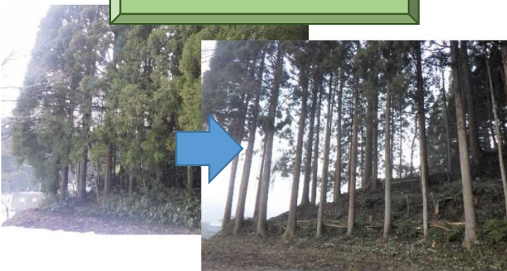
森林整備の実施 (福井県福井市の事例)