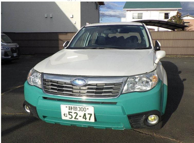
スバルフォレスター 静岡300む5247

※ 車両については、現場作業で使用していたため、車内は油及び泥汚れ等がかなりあります。また、車外についても傷、凹み等の損傷がありますので現物熟覧をお願いします。