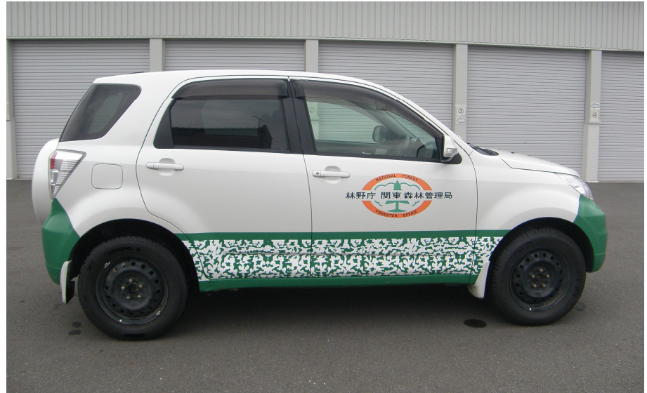
車両側面（運転席側）