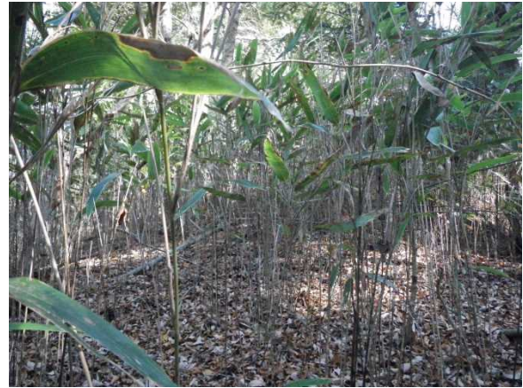
(旧林木 木戸川コナラ)