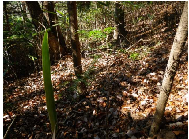
(旧植物 木戸川コナラ・モミ等)