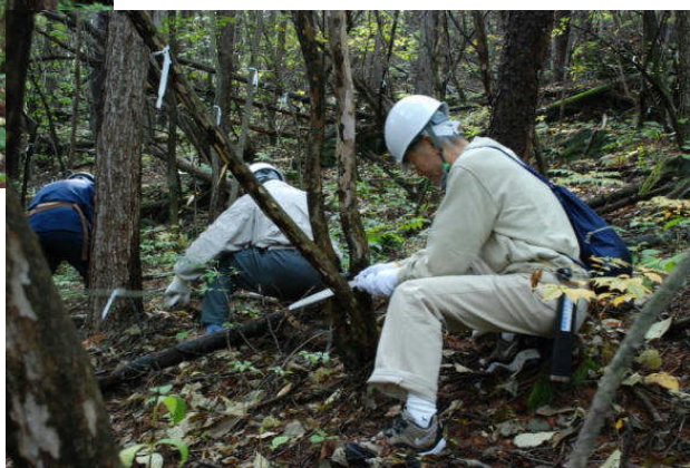
みるみるきれいに