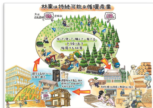
森林業循環活用図(作：平田美紗子)