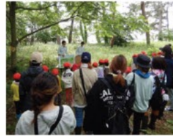
環境学習・林業体験