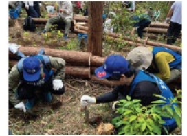
企業の森林づくり