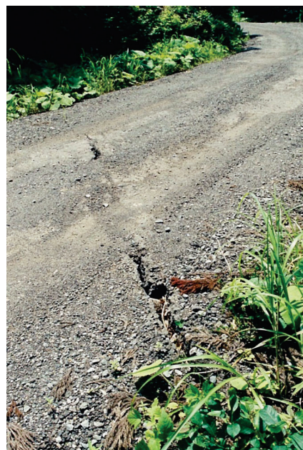
④ 作業道を横断する亀裂