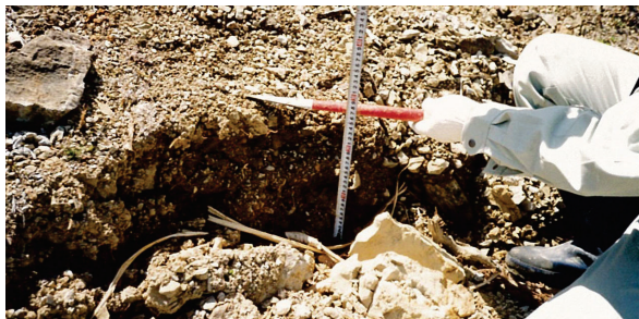
③ 冠頭部滑落崖段差