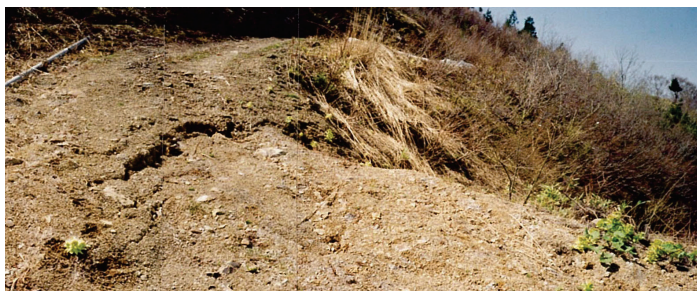
② 冠頭部を通る作業道の亀裂