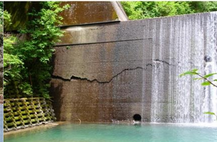
被災状況：谷止工のクラック