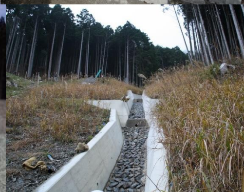
保全対象：下流集落（落合地区）