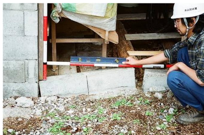
被災状況：民家基礎のクラック