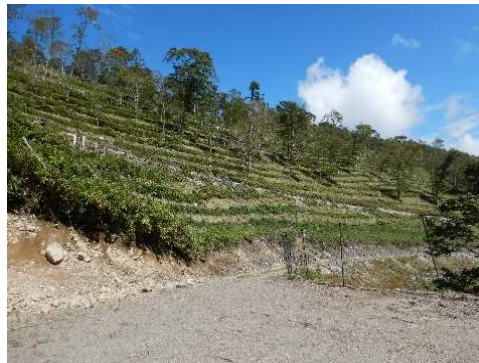
令和4年度 南信森林管理署 下刈