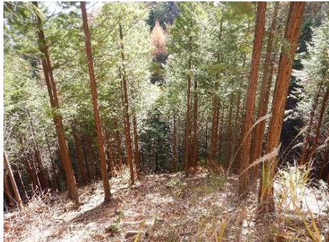
令和4年度 南信森林管理署 保育間伐