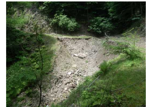
路網整備事業(林道改良工事)