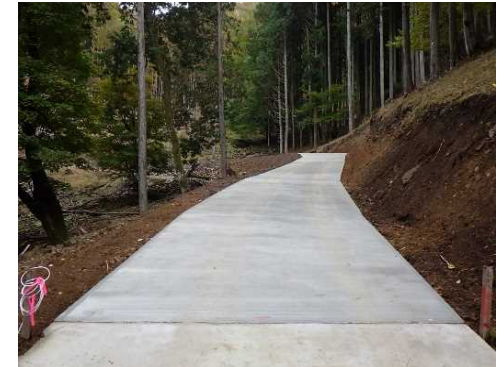
令和3年度 南信森林管理署 観音沢林業専用道特殊修繕