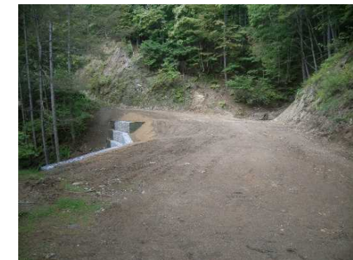
令和3年度 南信森林管理署 西谷林道改良工事