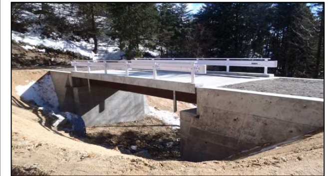
平成26年度 東濃森林管理署 夕森田立(丸野)橋梁架設工事