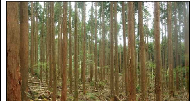
平成29年度 東濃森林管理署 保育間伐