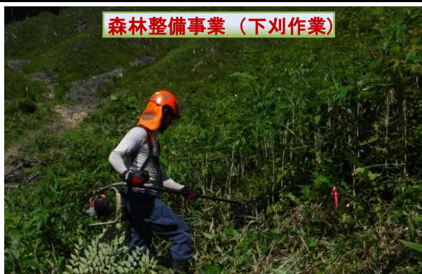
平成28年度 東濃森林管理署 下刈