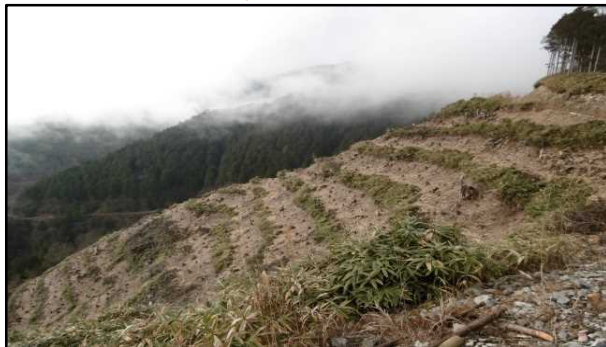
平成28年度 東濃森林管理署 地拵