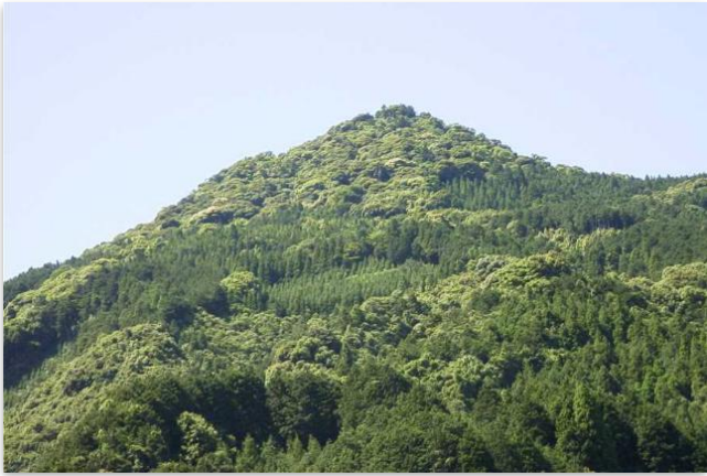
唐泉山スタジイ遺伝資源希少個体群保護林