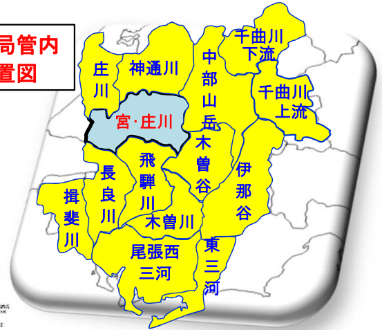
中部森林管理局管内 森林計画区位置図