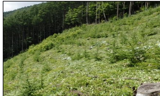
南信森林管理署 下刈