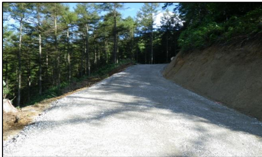
南信森林管理署 兀嶽林道新設工事