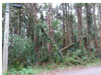
インフラ施設周辺の手入れ不足の森林

インフラ施設により林地が分断され、重機が入れない、木材搬出ができない等により、森林所有者による面的な森林整備が進みにくい森林について整備を行う必要がある。