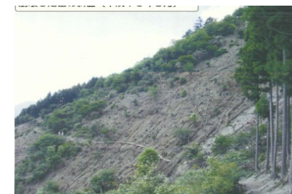
食害により荒廃した森林の様子