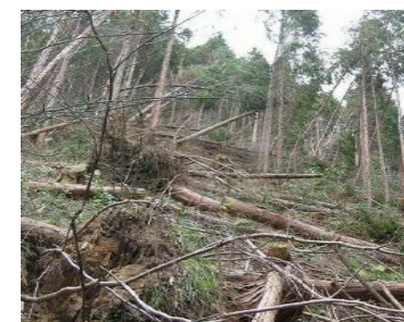
台風による風倒木の様子

台風により、所有する森林において大量の風倒木が発生したが、自力では風倒木の処理や植栽等が困難である。