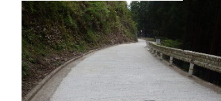
コンクリート路面工

豪雨等による路面の侵食や泥濘化（ぬかるむこと）の防止、自動車通行による損傷の抑制のため、堅固な路面を構築