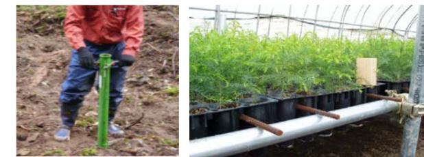
培土付きなので通常の苗より植付適期が長いコンテナ苗を活用

主な支援対象者：都道府県・市町村・森林整備法人・森林組合・NPO法人等 支援対象作業：スギ人工林等の伐倒、搬出集積、地ごしらえ、植栽 支援の条件：地域・対象年齢の制限なし (市町村森林整備計画への適合は必要) 植栽に当たっては、花粉症対策苗木等(知事が認める広葉樹等を含む)のコンテナ苗を使用し、一貫作業によること。