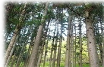
人工林資源が豊富な区域