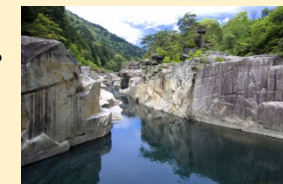
中山道の名勝寝覚の床

中山道の名勝寝覚の床を望む高台に位置するねざめホテル。付近には中山道の立場茶屋跡が残り、往時をしのべます。