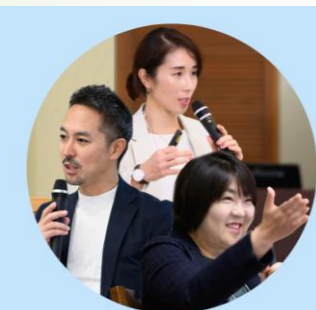
「ももも」 企業による森林サービスを活用した新たな価値づくりプロジェクト