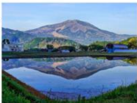
写真：アクティビティの拠点(船山)

久々野地域は高山市の南部に位置し、果樹や蔬菜の栽培が盛んな地域です。近年は閉鎖したスキー場の跡地等を利用しさまざまなアクティビティの展開が始まっています。