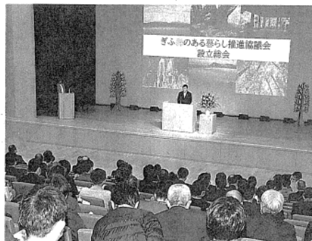
森林サービス産業の育成と山村地域の活性化を目指す協議会の設立総会＝県庁

森林空間を健康や観光、教育などの分野で活用して山村の活性化を目指す「森林サービス産業」の育成を主導する官民連携の組織「ぎふ森のある暮らし推進協議会」が、県庁で設立総会を開き発足した。岐阜県をアウトドアの聖地に掲げ、事業者の支援や情報発信を担う。