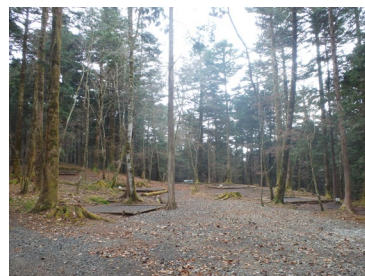
テントサイト周辺除伐後