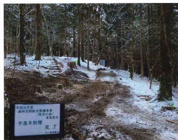
遊歩道周辺除伐後

令和2年度は、利用者が安心して散策できる明るい林地に誘導することを目的に、不要木や密度管理のための除伐を行った。