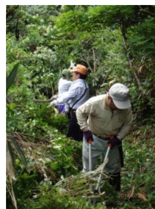
▲山道の整備。道なき道を進む