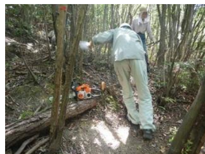
▲高い技術もつボランティアスタッフ