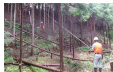
▲除間伐による里山林整備作業