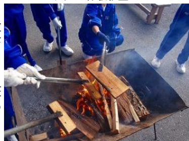
▲間伐材を使った焼板プレート体験