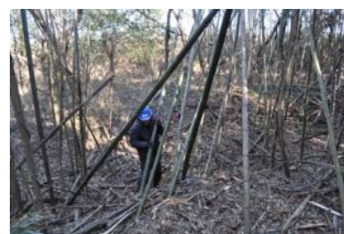
▲荒れ果てた竹林を整備し、竹材を得る