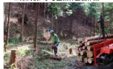
▲間伐材の搬出作業(木の駅に出材される)