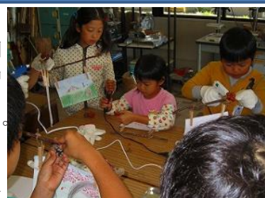
▲クラフト体験教室