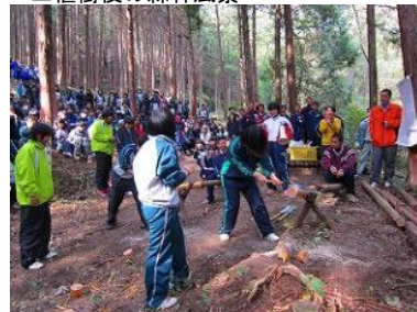
▲クラス対抗の丸太切り大会