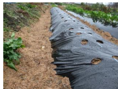
▲チップ化した竹を畑に散布