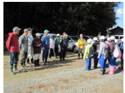
▲自然体験活動が始まります