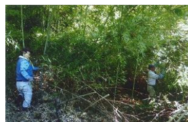
▲整備活動中の竹林内