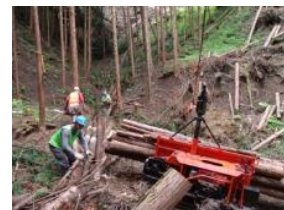
▲集積作業も安全教育が基本