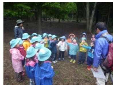
▲自然体験を指導するボランティアスタッフ