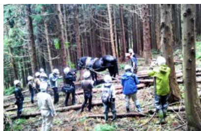
▲馬搬への関心は高い(ワークショップの様子)