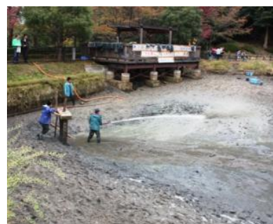
▲伝統的な資源循環システム「ドビ流し」