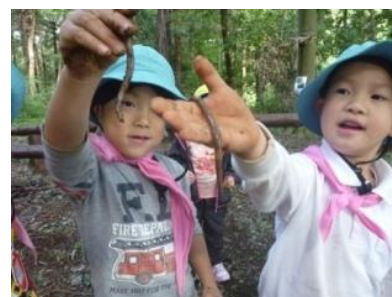
▲森林体験教室での、いきもの探し