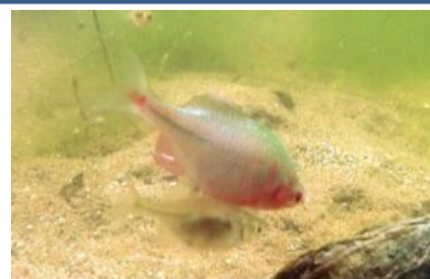
▲「絶滅危惧ⅠA種」ニッポンバラタナゴ