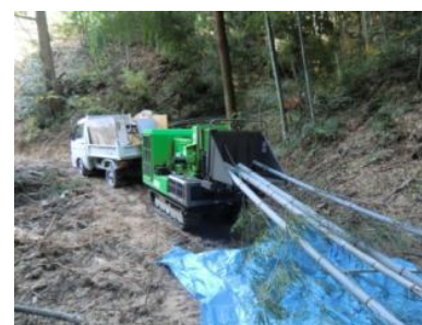
▲チップパーにより竹を粉砕