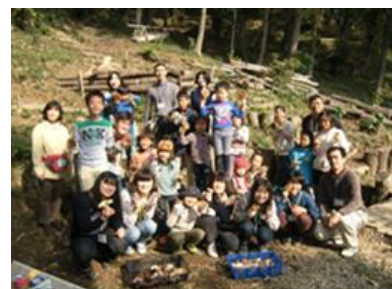
▲地域交流イベント(キノコ栽培親子教室)