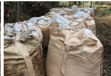
▲袋づめされた竹チップ