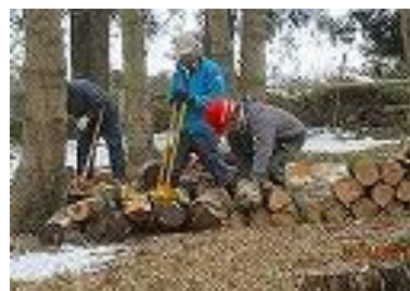
▲風倒木の処理・運搬作業