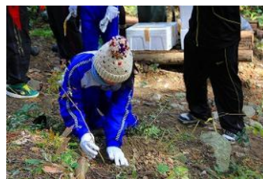
▲整備後の植林の様子