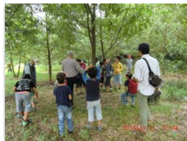
▲自然観察会の様子