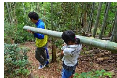
▲伐採した竹の搬出風景