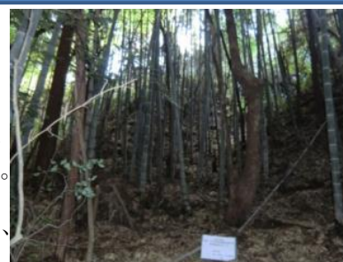
▲整備前の荒れた竹林の様子