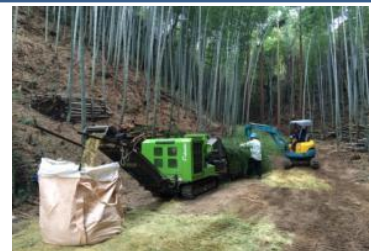
▲竹チップは運搬しやすいように袋詰