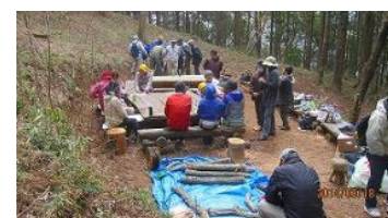
▲観察体験会での参加者誘導・案内