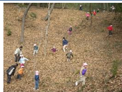
▲幼稚園児の里山遊び体験