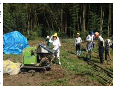
▲竹材のチップ化体験(環境学習会)