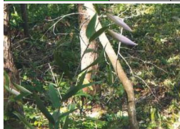
▲芽を出し花を開いたササユリ