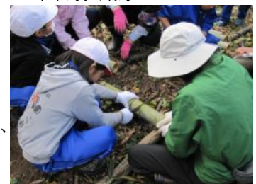
▲門松づくりに使う竹を切る児童