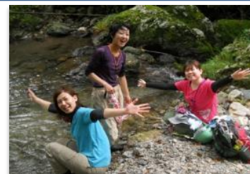
▲女性の参加者も多い