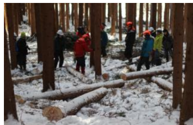
▲馬搬技術の指導中