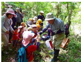
▲地域住民との森遊び