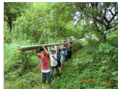
▲伐採した竹を運び出す子どもたち