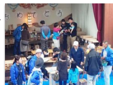
▲隊員が製作した木工製品を販売