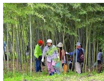
▲会員の指導によるタケノコの収穫体験