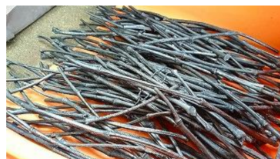
▲伐採した竹を生かした炭焼き