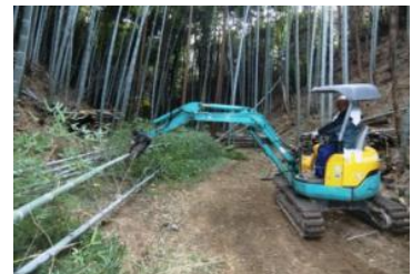
▲チップパーまでは重機で作業