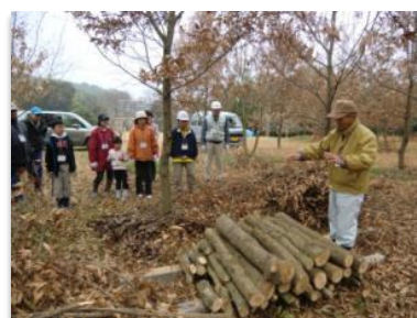
▲キノコの栽培について説明