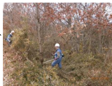
▲下草刈りを行い、遊歩道を整備