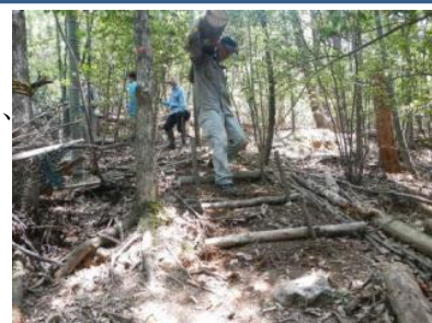
▲地域住民が協力して遊歩道の整備