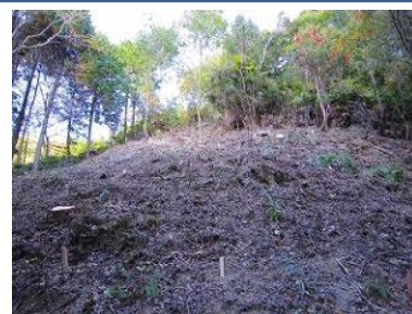
▲植樹後の森林風景