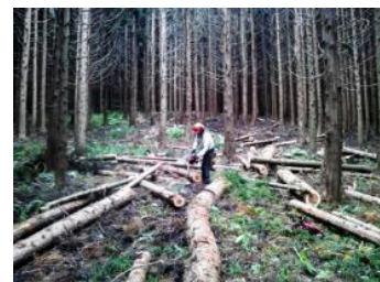
▲杉林の間伐と造材作業