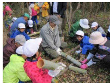
▲指導を受けながら竹を切る子どもたち