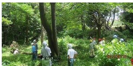
▲安全利用講習会での講師による資機材使用の説明