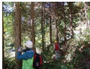
▲選木作業を実施中