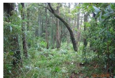
▲整備活動前の里山林内