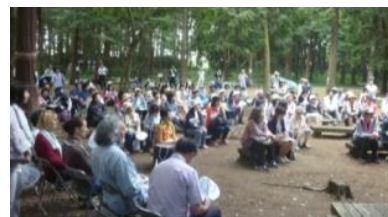
◀整備された林で 実施された 日仏教育交流会