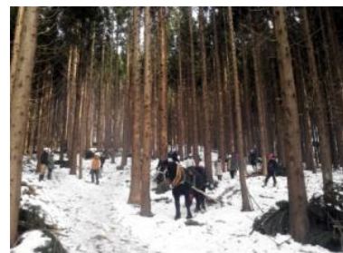
▲馬搬デモンストレーションの実施