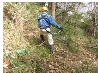
▲草刈機による下草刈り