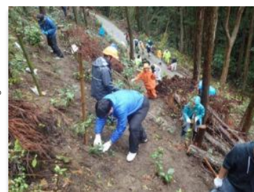
▲整備した里山に植樹