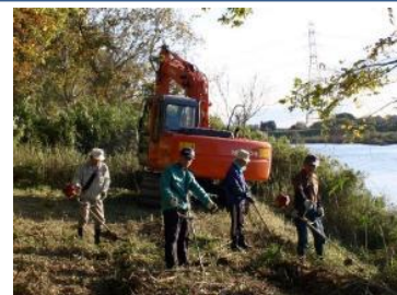
▲鬼怒川沿いの整備が進む