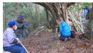
▲観察体験会のための整備作業