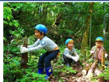
▲園児によるタケノコ採り体験