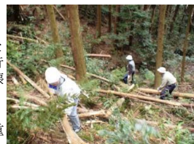
▲間伐と遊歩道づくりによる土留め