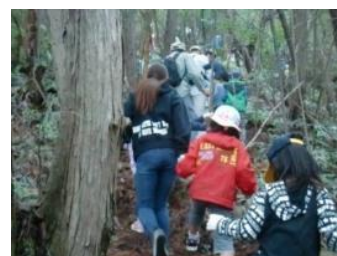
▲山科醍醐こどもひろばとの交流