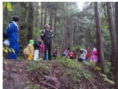
▲地域住民との森林探検