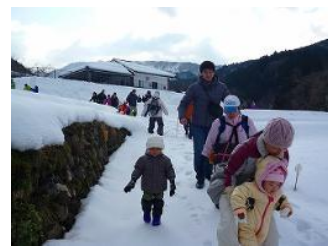
▲地域住民と雪上トレッキングの様子