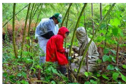
▲タケノコ収穫体験(タケノコを掘っている様子)