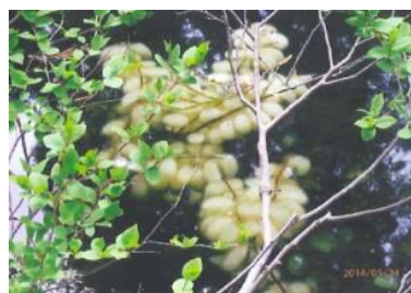
▲発見されたクロサンショウウオの卵