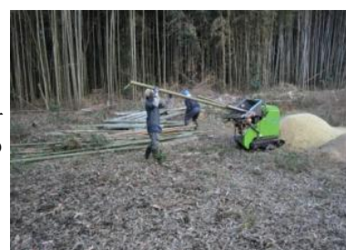
▲竹材を木材チップパーでチップ化