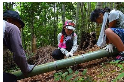
▲地域の子どもたちとの竹林伐採