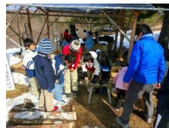
▲間伐材を活用した木炭づくり体験