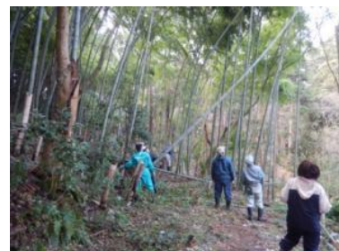
▲竹林の伐採の様子