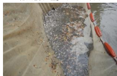
▲ニッポンバラタナゴの個体数が回復