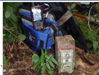
▲携帯GPS機器を使用して山道の位置の特定・森林境界の計測を実施