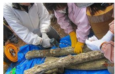
▲会員の指導によるシイタケ駒打ち体験