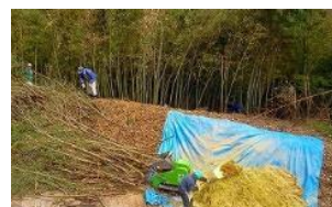
▲パウダー状の竹チップ生産作業