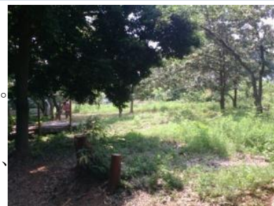
▲下草刈り前の林の様子