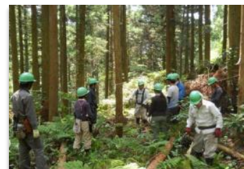
▲間伐の研修会で人材育成