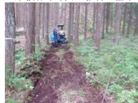
▲作業道造り作業中