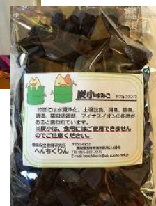
▲消臭効果のある竹炭商品