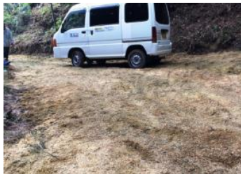
▲竹チップを里山道に敷き詰め悪路を整備