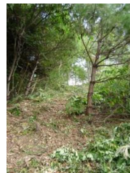
▲遊歩道を整備し、森林資源の有効活用を進める