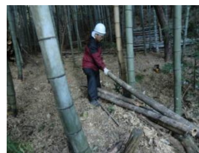
▲伐採した竹で棚を作る