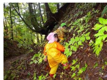
▲園児の森林探検の様子