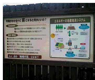
▲恵那市山岡町花白温泉の「やまおか木の駅」