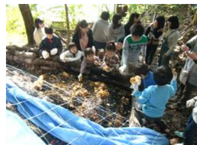
▲森の恵み(キノコ栽培場)