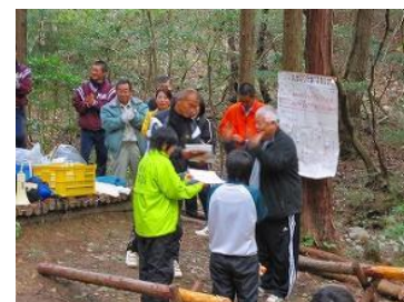
▲学校林での体験プログラムの様子