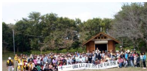
▲自然体験活動には多くの親子が参加し楽しんでいる