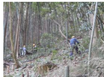
▲体力的に厳しい急斜面での作業