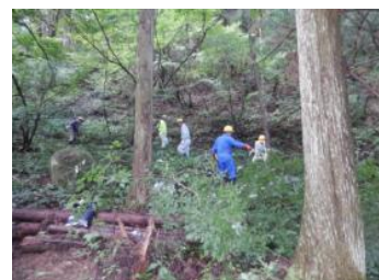
▲共に活動する中で、地域の団結力が高まった