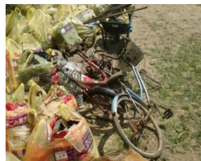
▲不法投棄物清掃で集められた廃棄物