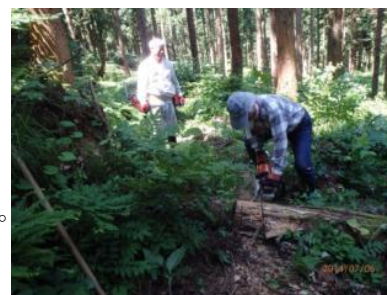
▲倒木を分割して運び出す