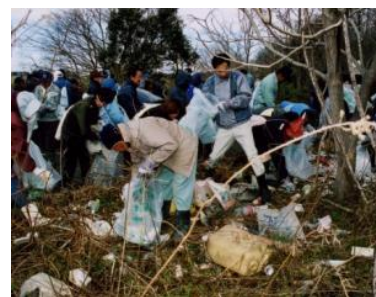
▲住民参加による不法投棄のゴミ処理