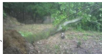
▲台風被害により根こそぎ倒れた倒木