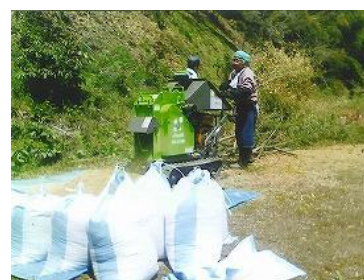
▲チップパー処理による袋詰め作業