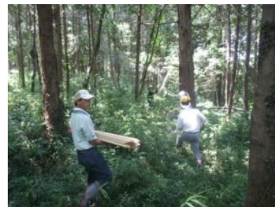
▲里山整備に励む地域住民