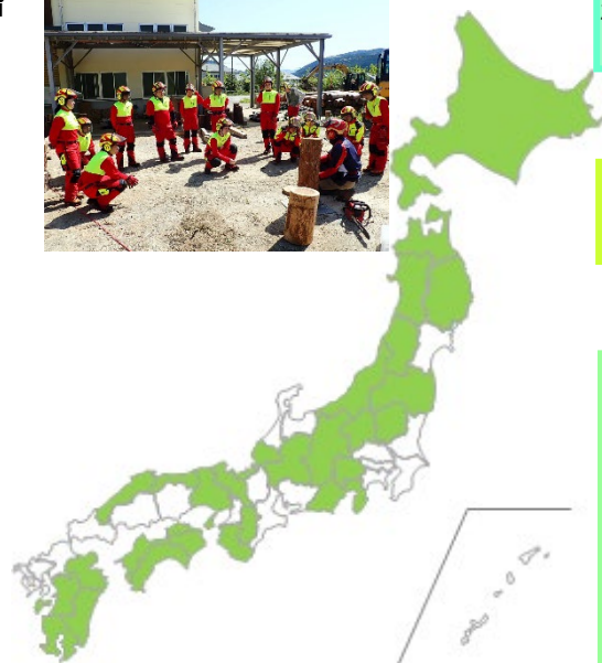
給付金給付対象都道府県の状況 （令和7年度28道府県）