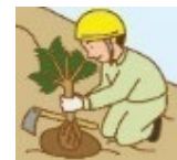
集合研修やOJT研修による知識・技術・技能の習得

〔新規就業者〕安全で効率的な 知識・技術・技能 を習得するための 3年間の体系的な研修