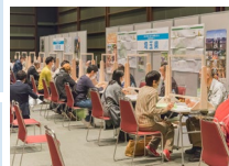
就業ガイダンスの様子