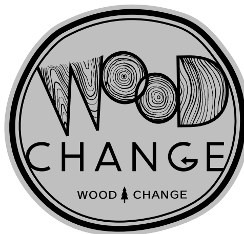
グレースケール表示