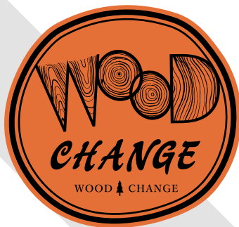
フォントを変えない