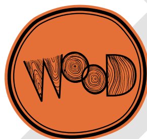
要素をバラさない