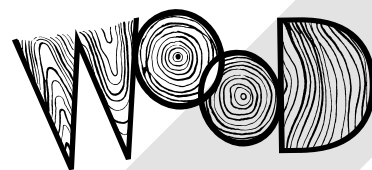
単独で使用しない