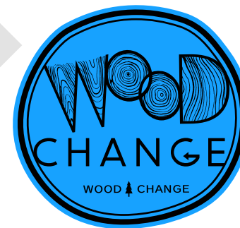
表示色を変えない