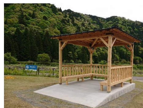
清流長良川あゆパーク東屋