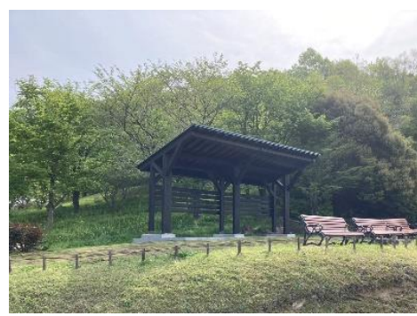
ぎふワールド・ローズガーデン東屋