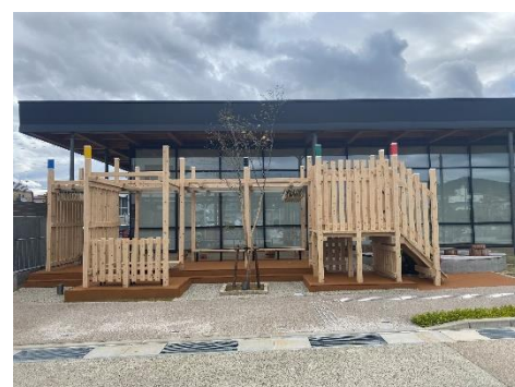
ぎふ木遊館休憩施設