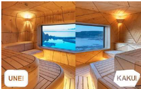
北こぶし知床ホテル&リゾート UNEUNA／KAKUUNA 株式会社アーティストリー／株式会社知床グランドホテル／TTNE株式会社／株式会社河面組 建築・空間分野

川沿いに点在する休憩場所やサインのデザインを統一し、エリア全体で木材に触れ、安らぐ時間を提供している点が良い。サイクリングの開放感と地域の自然、景観を堪能するにふさわしい体験装置としての環境デザインと言える。