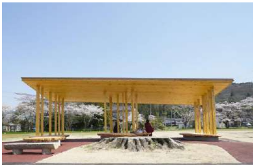
サイクリングロード “旭川・りんくるライン” 株式会社ofa／真庭市／株式会社タブチ／株式会社松岡建設／株式会社MID研究所／SASA ATORIE 建築・空間分野

川沿いに点在する休憩場所やサインのデザインを統一し、エリア全体で木材に触れ、安らぐ時間を提供している点が良い。サイクリングの開放感と地域の自然、景観を堪能するにふさわしい体験装置としての環境デザインと言える。