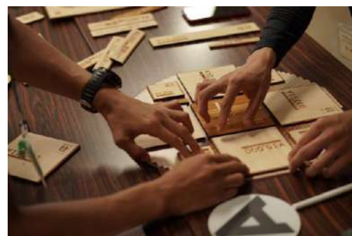
セーザイゲーム 熊野林星会 コミュニケーション分野

昨今のサウナブームにより各所に増えているサウナだが、一般的には羽目板の壁など空間が均一化しがちである。本作品は空間全体で木に包まれているような感覚になる優れた意匠性を持つ希少なサウナである。立地の良さと相まって、五感で感じるサウナ空間となっている点を高く評価した。