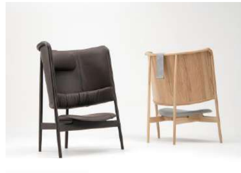
フラン リビング 株式会社カンディハウス プロダクツ分野

戸建て住宅が並ぶ「街」を想起させる、コミュニティ機能を持つクリニックである。既存の医療空間にありがちな無機質な空間ではなく、木材を多用し居心地のよい空間を実現しており、医療や育児、街の交流拠点として人をひきつける魅力がある。子どもを産み育てる地域の人々によるコミュニティでありたいという思いが伝わる建築である。