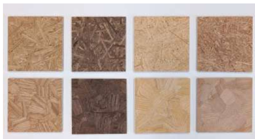
VARABOARD 株式会社山崎商事／株式会社エスウッド 技術・建材分野

突板の薄さを活かしながら、樹種ごとの特徴、質感を活かした化粧ボードであり、空間のテイストに合わせて様々な用途での活用が見込める製品。