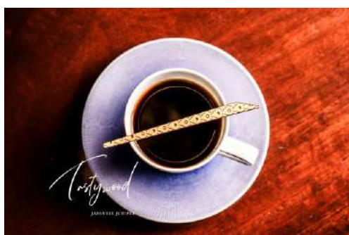
tastywood ～JAPANESE JUNIPER～ 有限会社一場木工所／株式会社レオンハルト／ 蒸留ラボ Laboratory Pnacea／込山 宏美／青 水里山の会／アートの小箱 プロダクツ分野

木組みの格子の意匠が特徴的な新しいインテリアの提案である。室内を彩る細やかな細工があり、隠すという概念に着目した点に新規性がある。