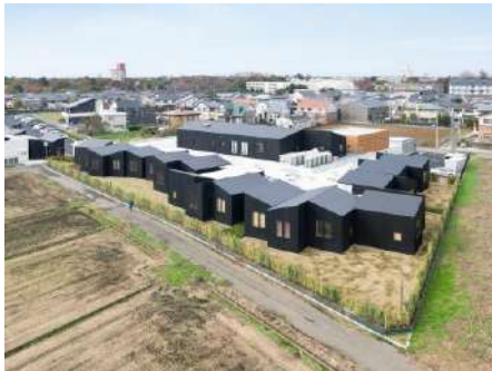
なないろこまち 株式会社黒田潤三アトリエ／医療法人社団清虹会／株式会社東武建設 建築・空間分野

凹型の敷地形状を活かし、エリアごとに木質構造の課題解決に向けた取組を採用した新規性ある建築である。木質感が溢れる外観、木造エリアのエントランスホールなど街に開かれた顔を持ちつつ、執務室や交流空間は、内装木質化が優しくワーカーや来訪者をもてなしている点も良い。