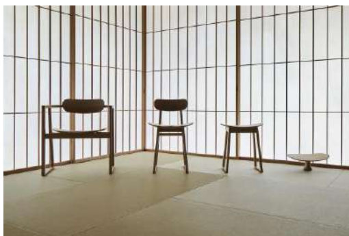
SUWARI 飛騨産業株式会社 プロダクツ分野

突板の薄さを活かしながら、樹種ごとの特徴、質感を活かした化粧ボードであり、空間のテイストに合わせて様々な用途での活用が見込める製品。