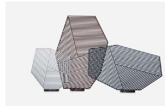
SHA/SHA 中井産業株式会社 プロダクツ分野

和の空間にもマッチする洗練されたデザインの椅子である。強さと軽さの両立、畳を始めとした床への負担を抑える工夫など随所に工夫が凝らされている。