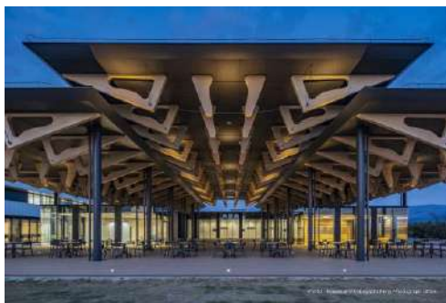
東海大学阿蘇くまもと臨空キャンパス食品加工教育実習棟 株式会社石本建築事務所／東海大学／三井住友建設株式会社／山佐木材株式会社 建築・空間分野

伝統的な建築を想起させる空間づくりが、各国から訪れる選手や関係者へ向けて日本の木の使い方や技、空間の味わいの素晴らしさを発信している。組立解体を前提とした設計、構造と細部に至る各地域の木材の使い方など、日本の木材文化のショールーム的な役割を担う素晴らしい取組である。