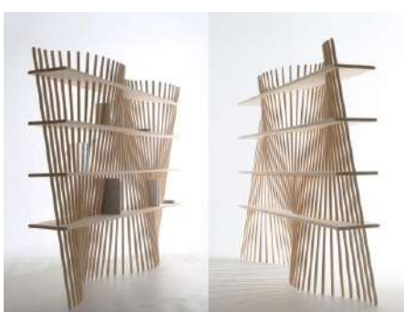
shell × shelf 株式会社阿部蔵／森庄銘木産業株式会社 プロダクツ分野

ネズミサシという森林資源の活用を目指したプロダクトであるが、マドラーとしてかき混ぜると味がまろやかになるユニークな作品。山への還元と五感への訴求を両立した。