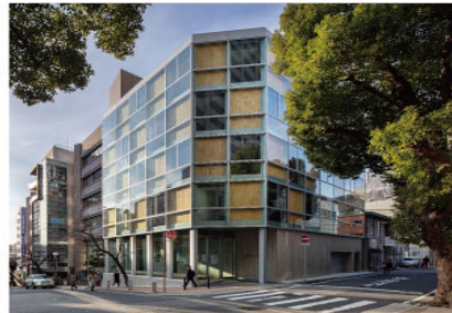
CLTを225 3 m活用した兵庫県森連新事務所