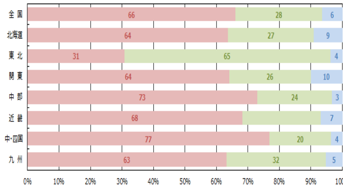
■減少 ■横ばい ■増加