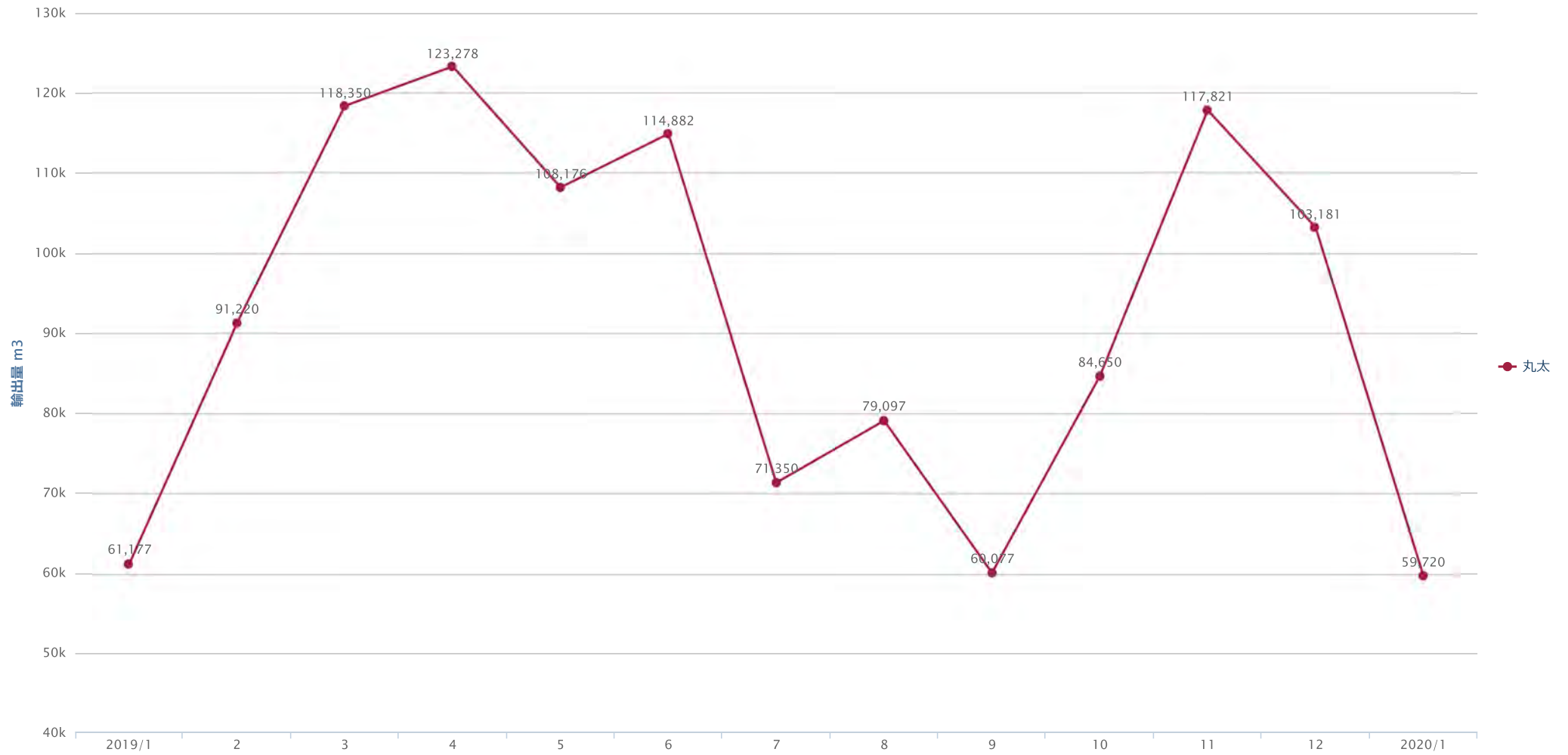
丸太の輸出量の推移