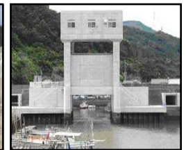
津波・高潮対策としての水門整備

（共通）切迫する南海トラフ地震、日本海溝・千島海溝周辺海溝型地震等の発生を見据えた防災インフラ整備