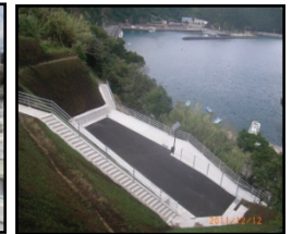
漁村における津波避難対策のための津波避難対策（避難地、避難路の整備）