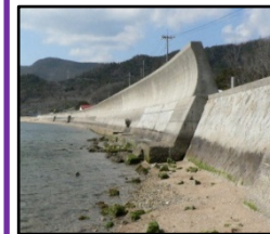
津波、高潮による被害を未然に防ぐため海岸堤防の整備を推進