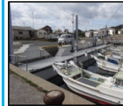
漁業作業の効率化と安全対策のための漁港整備（岸壁改良）