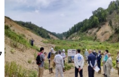
北海道厚真町の被災森林