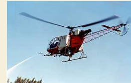
薬剤のヘリ空中散布