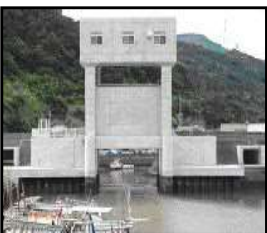
津波・高潮対策としての水門整備

（共通）切迫する南海トラフ地震、日本海溝・千島海溝周辺海溝型地震等の発生を見据えた防災インフラ整備