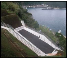
漁村における津波避難対策（避難施設、避難経路の整備）