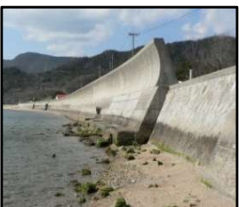
津波、高潮による被害を未然に防ぐため海岸堤防の整備を推進