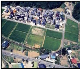
ほ場整備による農業生産性の向上と秩序ある土地利用の推進