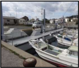
漁業作業の効率化と安全対策のための漁港整備（岸壁改良）