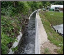
老朽化した用水路の整備・更新