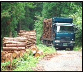
林道等の整備により効率的な間伐材等の搬出を実現