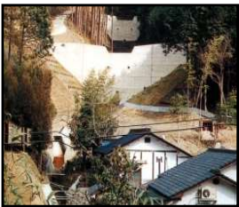
治山施設による山地災害の未然防止