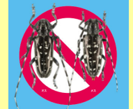
ツヤハダゴマダラカミキリ対策