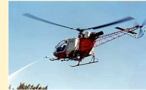
薬剤のヘリ空中散布