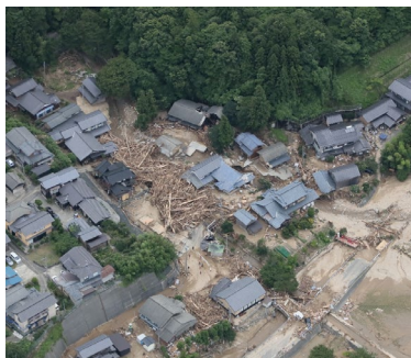
頻発・多様化する流木災害