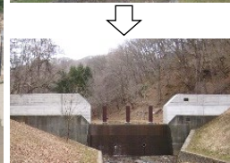
機能強化対策の強化