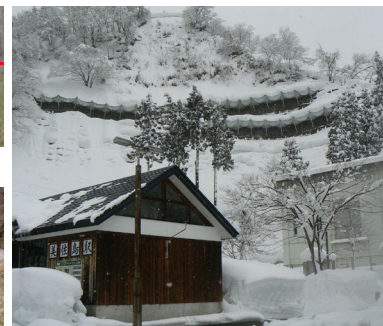
積雪地域の治山対策の強化