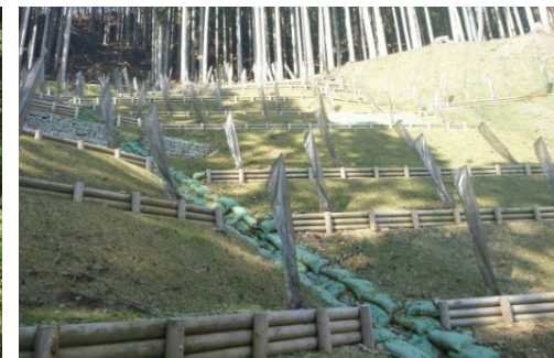
2級水系への流域治水の連携拡大とEco-DRRの強化

※ このほか、治山事業におけるICT化を推進するとともに事業実施主体の事務負担を軽減するため、 ICT施工の導入に伴う設計書の変更協議を簡素化 します。