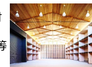
CLTを活用した設計・建築実証