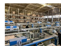
木材加工施設の整備