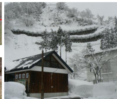
積雪地域の治山対策の強化