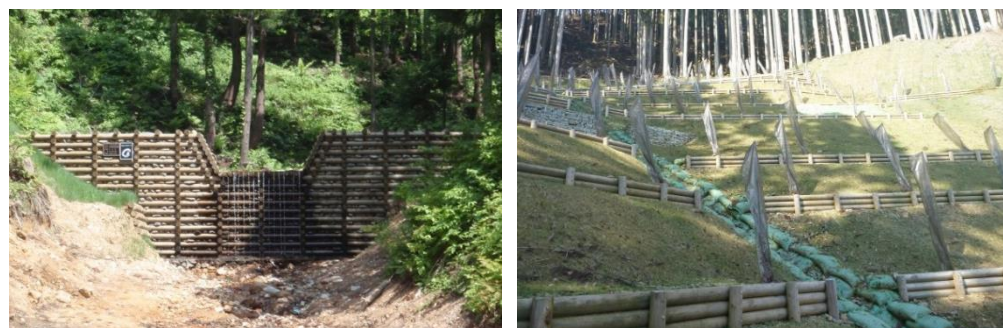
2級水系への流域治水の連携拡大とEco-DRRの強化

※ このほか、治山事業におけるICT化を推進するとともに事業実施主体の事務負担を軽減するため、 ICT施工の導入に伴う設計書の変更協議を簡素化 します。