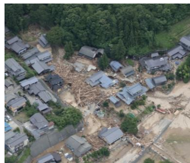
頻発・多様化する流木災害