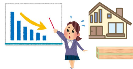
風評被害防止対策の実施