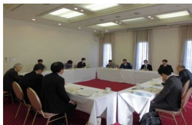
安全証明体制に向けた有識者検討会