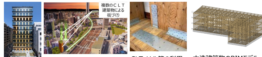
CLTを活用した先駆的な建築物の実証