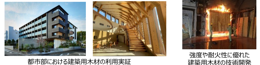
都市部における建築用木材の利用実証