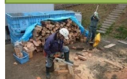
薪や原木としての利用