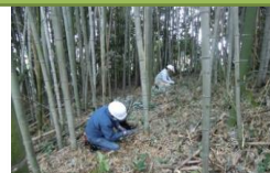
侵入竹の伐採・除去