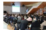
フォーラムの開催