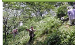
里山林の機能維持