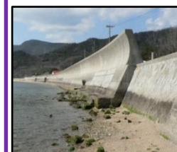
津波、高潮による被害を未然に防ぐため海岸堤防の整備を推進