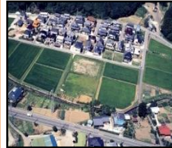
ほ場整備による農業生産性の向上と秩序ある土地利用の推進