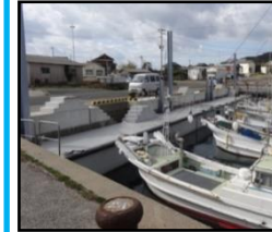
漁業作業の効率化と安全対策のための漁港整備（岸壁改良）