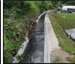
老朽化した用水路の整備・更新