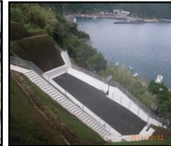
漁村における津波避難対策のための津波避難地、避難路の整備