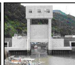
津波・高潮対策としての水門整備

（共通）切迫する南海トラフ地震、日本海溝・千島海溝周辺海溝型地震等の発生を見据えた防災インフラ整備