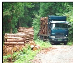
林道等の整備により効率的な間伐材等の搬出を実現