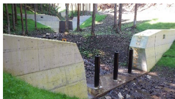
流木捕捉式治山ダムを設置