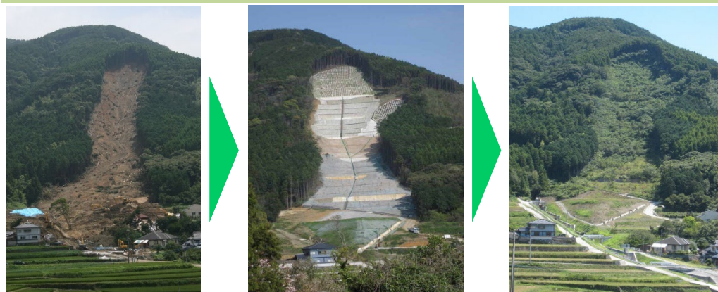
山地災害危険地区のうち、特に緊要度の高いエリアにおける治山施設の整備

山地災害危険地区や氾濫した河川上流域等を対象に、森林の有する土砂流出防止機能や水源涵養機能等の適切な発揮のため、流域治水の取組等とも連携しつつ、流木、土石流、山腹崩壊の発生を抑制する治山施設の整備等を推進します。