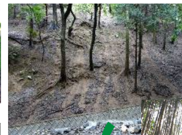
土砂の流出・侵食を防止し、森林の保水機能を向上