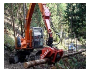
＜材の枝払い、玉切り等を連続して行う高性能林業機械＞

・意欲ある木材加工業者等に対する 高性能林業機械 の導入 ・農業・建設業等 他産業、他地域 との連携の推進