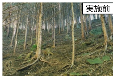
防災・保水機能を高めるための森林整備

森林の防災・保水機能を発揮させるため、流域治水の取組等とも連携しつつ、 山地災害危険地区や重要なインフラ周辺等のうち特に緊要度の高いエリア、氾濫した河川上流域等 を対象に間伐、再造林等の森林整備を推進します。