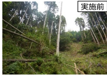
防災機能の強化に向けた路網整備