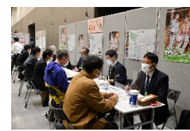
就業ガイダンスの様子