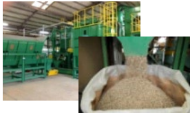
ペレット製造施設及びペレット