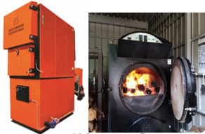
木質資源利用ボイラー