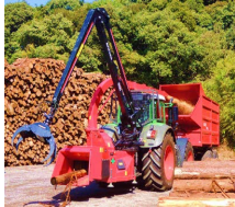
移動式チップパー及び油圧式チップタンク