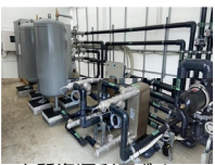
木質資源利用ボイラー