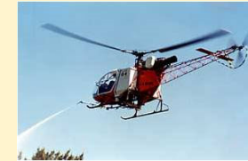
薬剤のヘリ空中散布