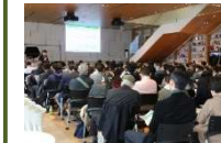
フォーラムの開催