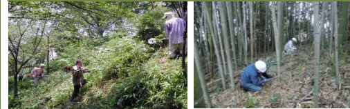
里山林の機能維持