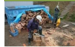
薪や原木としての利用