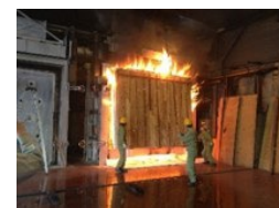
強度や耐火性に優れた建築用木材の技術開発