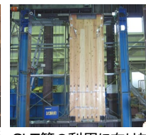
CLT等の利用に向けた技術開発