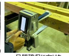
品質確保に向けた性能検証