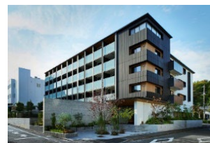
都市部における建築用木材の利用実証