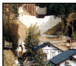
治山施設による山地災害の未然防止