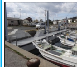
漁業作業の効率化と安全対策のための漁港整備（岸壁改良）