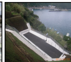
漁村における津波避難対策のための漁港整備（避難地、避難路の整備）