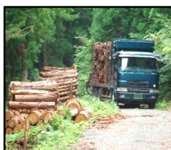
林道等の整備により効率的な間伐材等の搬出を実現