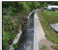
老朽化した用水路の整備・更新