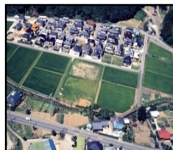
ほ場整備による農業生産性の向上と秩序ある土地利用の推進